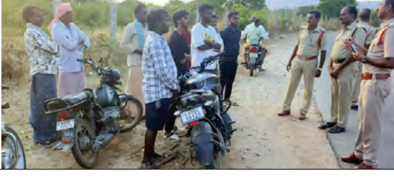
వాహనదారులకు కౌన్సిలింగ్ ఇస్తున్న ఎన్ఐఐ