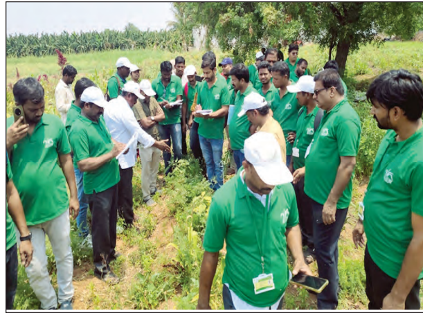
ప్రకృతి వ్యవసాయం పై అవగాహన కల్పిస్తున్న అధికారులు

బుక్కరాయసముద్రం ఏప్రిల్ 12 ప్రభాతవార్త బుక్కరాయసముద్రం మండల కేంద్రంలో ప్రకృతి వ్యవసాయం పై విస్తృత స్థాయి అవగాహన కార్యక్రమం నిర్వహించడం జరిగింది. ఈ కార్యక్రమం సిటిబి, డిపిఎం లక్ష్మీనాయక్ అదేశాల మేరకు ఈ కార్యక్రమం చేపట్టడం జరిగింది. ఈ కార్యక్రమం రైతు భాగ్యలక్ష్మి టి-పసిఆర్పి ప్రదీప్ పొలంలో నిర్వహించడం జరిగింది. ఈ కార్యక్రమం రంగస్థాయి (డిజి ఫెసిలిటేటర్) అధ్యక్షులతో నిర్వహించారు. ఈ సందర్భంగా ప్రకృతి వ్యవసాయం సిబ్బంది పెద్దన్న మాట్లాడుతూ ప్రకృతి వ్యవసాయం రైతులకు అర్థకంగా లాభదాయక మనిషివలించారు. రసాయనిక ఎరువుల ఖర్చులను తగ్గించి స్థానికంగా లభించే వనరులతో పంటలు సాగు చేయడం ద్వారా రైతులు ఎక్కువ ఆదాయం పొందవచ్చని తెలిపారు. జీవామ్మతం, ఘన జీవామ్మతం, టీజామ్మతం వంటి పద్ధతులను రైతులు పాటించాలి నన్నారు. అనంతరం రంగస్థాయి మాట్లాడుతూ రసాయనిక ఎరువులు, పురుగు మందులు అధికం గా వినియోగం వల్ల అలోగ్నం వెబ్బుతింటుందన్నారు. ప్రకృతి వ్యవసాయం ద్వారా నేల సారం పెరుగుతుందని, వంటల నాణ్యత మెరుగుపడుతుందన్నారు. ఈ కార్యక్రమాన్ని డాక్టర్ నవీన్ సిబ్బంది సమర్థ వంతం గా నిర్వహించారు.