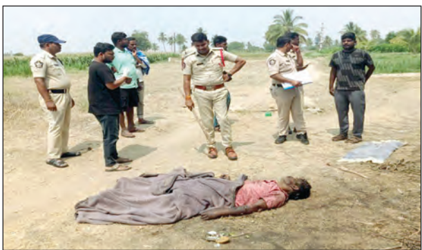
నంపుటనా స్థలాన్ని పరిశీలిస్తున్న సిఐ, ఎన్ఐఐ