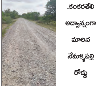
కంకరతేలి అధ్యక్షులుగా మాలన నేమళ్లప్పై రోడ్డు

చెందుతుండగా రాకపోకలు సాగిస్తున్న వారి అవస్థలు వర్షాకాలంలో ప్రజాప్రతినిధులు ఎన్నికై వారి పదవీకాలం ముగిసిపోయి ప్రత్యేక అధికారులు పాలన వైసు కన్నెత్తి చూడ కుండా నిర్లక్ష్యంగా వ్యవహరిస్తూ ప్రజలు, వాహన దారుల ప్రాణాలతో వెలగాలం అడుతున్నారన్న ఆరోపణలు బలంగానే వినిపిస్తున్నాయి. ఇప్పటికైనా ఉన్నతాధి కారులు సుందించి ప్రభుత్వాల లక్ష్యాలు కు అనుగుణంగా గ్రామీణ రోడ్లకు మహారథ కల్పిస్తూ ప్రజాసంక్షేమాన్ని ఆకాంక్షిస్తూ వారి అభ్యుత్పతికి పాటుపడ్డామని అవసరం ఎంతైనావుందని గ్రామీణ ప్రజలు కోరుతున్నారు.