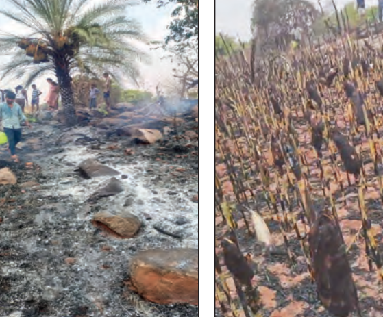
కాలి బూడిదైన పంట, మొక్కజొన్న కంటెలు కాలిన దృశ్యం.

1.59 లక్షల విలువైన పంట, శ్రీపుత్రి అగ్నికి ఆహూతి