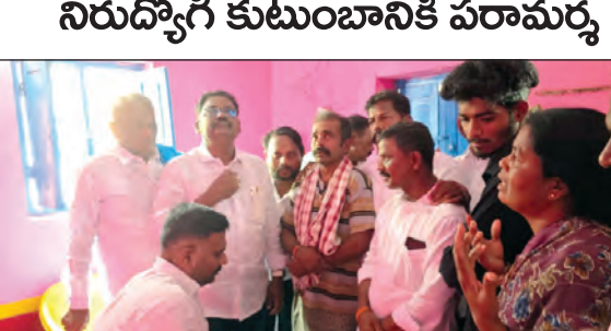
నారమ్మను పరామర్శిస్తున్న మాజీ ఎమ్మెల్యే కేతిరెడ్డి వెంకటరామిరెడ్డి