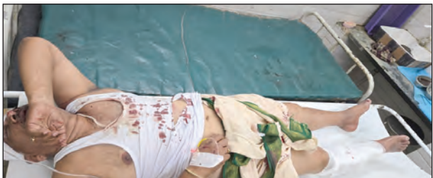
ప్రమాదంలో గాయపడిన ఎంకెఓ