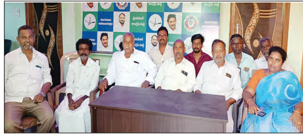
సమావేశంలో పాల్గొన్న వైసీపీ నాయకులు