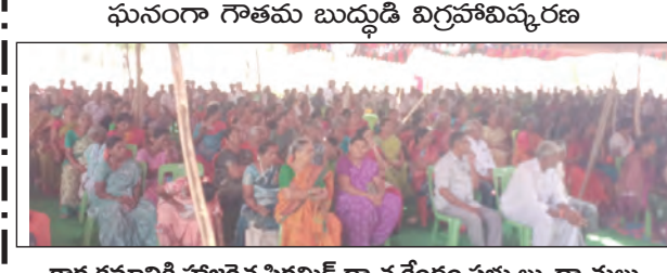
కార్యక్రమానికి హాజరైన పిరమిడ్ ధ్యాన కేంద్రం సభ్యులు, ధ్యానులు