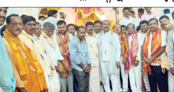
వేడుకల్లో పాల్గొన్న మాజీ ఎమ్మెల్యే దృశ్యం