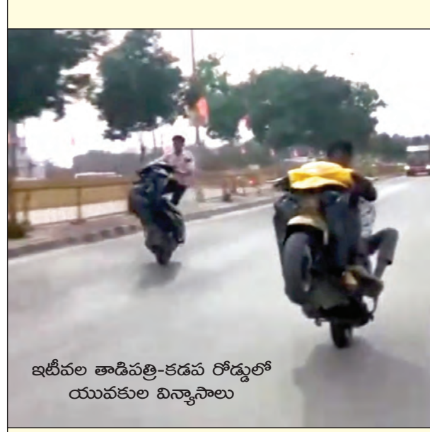
ఇటీవల తాడిపత్రి-కడప రోడ్డులో యువకుల విన్యాసాలు

తాడిపత్రి, ఏప్రిల్ 12, ప్రభాతవార్త ద్విచక్ర వాహనాల ప్రమాదాలకు ఆపరిచకృత చర్యను తో వాహనాలు నడపడటం కూడా ప్రధాన కారణంగా పోలీసులు భావిస్తున్నారు. ప్రమాదాల్లో అక్కడక్కడ మైనర్లు కూడా మరణిస్తుండటం గమనార్హం. కొందరు పెద్దలై పిల్లల గారాబానికి కలిగిపోయి ద్విచక్ర వాహనాలు ఇస్తుండటంతో వారు ఇద్దరు, ముగ్గురిని ఎక్కించుకొని రోడ్లపై చక్కర్లు కొడుతున్నారు. ఎక్కడ హూసీని ఎక్కువగా మైనర్ల ద్విచక్రవాహనాలపై కనిపిస్తున్నారు. ఇటువంటి ప్రమాదాలకు ప్రయాణాలపై పోలీసులు ఎంతగా అవగాహన కల్పిస్తున్నా పరిస్థితిలో మార్పు కనిపించడం లేదు. అదంతటం జిల్లాలో ద్విచక్రవాహన ప్రమాదాలు రోజు రోజుకు పెరుగుతున్నాయి. వీటికి అనేక కారణాలున్నా అవరిచకృత చర్యను తో వాహనాలు నడిపే యువకుల పరిస్థితి అందరినీ కలవర పెడుతోంది. పిల్లలు ఇంట్లో గారాంబం చేస్తున్నారని, అందరినీ చేస్తున్నారని పెద్దల వారికి వాహనాలు కొనిపెట్టడం, తమ ఆపరలకొన కోసం కొన్న వాహనాలను మైనర్ల చేతికి ఇవ్వడం చేస్తున్నారు. ఈ పరిస్థితిని నివారించడానికి కఠిన చర్యలున్నా అవి సక్రమంగా అమలుకు నోచుకోవడంతో పరిస్థితిలో మార్పు కనిపించడం లేదు.