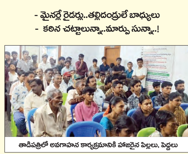
తాడిపత్రిలో లభాహాన కార్యక్రమానికి హాజరైన పిల్లలు, పెద్దలు