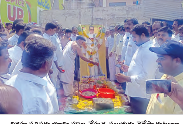
విగ్రహ ప్రతిష్ఠకు భూమి పూజ చేస్తున్న పలువురు తెదేపా కుటుంబ సభ్యులు