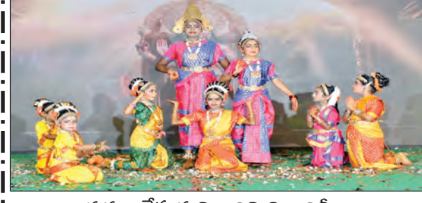
నృత్యం చేస్తున్న విద్యార్థులు విద్యార్థినిలు

- విద్యార్థులు సాంస్కృతిక కార్యక్రమాలతో అందరినీ ఆకట్టుకున్నారు... - విద్యార్థుల ప్రదర్శనలు ప్రేక్షకులను ముగ్ధులను చేశాయి