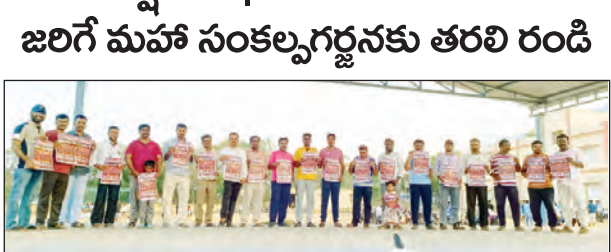
మహాసంకల్ప గర్జన పాఠశాలను విడుదల చేస్తున్న దృశ్యం