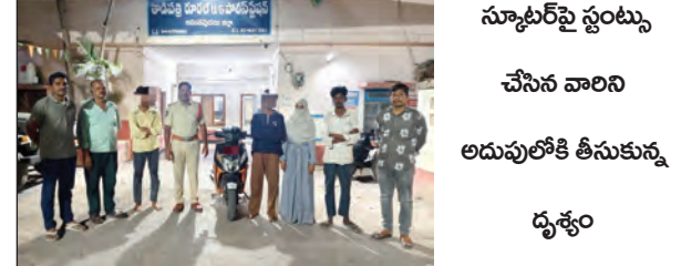
స్టంట్లు చేసిన వారిని అదుపులోకి తీసుకున్న డ్యూటీ