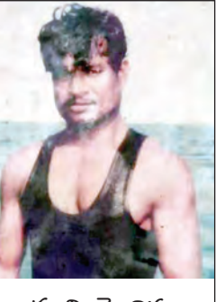
మృతి చెందిన బావిరెడ్డి (ఫైలెఫోటో)