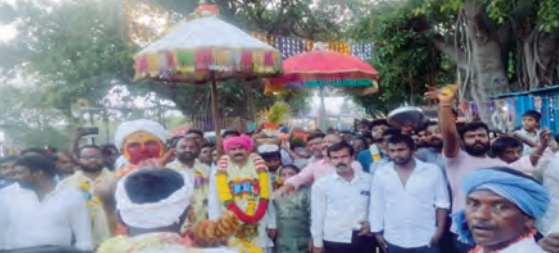
ప్రత్యేక అలంకరణలో పోతురాజు నాట్యం చేసేసినట్లు దృశ్యం