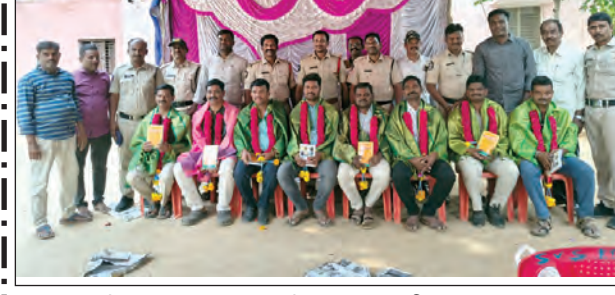
బదిలీపై వెళ్ళిన పోలీసులకు ఆత్మీయ సత్కారం

నిర్వహిస్తున్న సిఐ, ఎస్సై, మిగతా సిబ్బంది