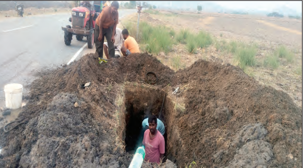
పైపుకు మరమ్మతులు చేస్తున్న కార్మికులు

పైపుకు మరమ్మతులు చేస్తున్న కార్మికులు పైపుకు మరమ్మతులు చేస్తున్న కార్మికులు మండలంలోని ప్రధాన త్రాగునీటి వనస్థాన సత్వసాయి మందిరీటి ప్రాజెక్టు పైపులు అను నిత్యమూ పరిశీలించడం మండల వ్యాప్తంగా ప్రధానంగా 13 గ్రామాలలో నీటి ఎద్దడి నెలకొని ప్రజలు దాహంతో అల్లాడిపోతున్నారు. సత్వసాయి మందిరీటిని సరఫరా చేసే పైపులు కాలం చెల్లడంతో పైపులు పగిలిపోవడం నిత్య కార్యక్రమంగా మారింది. దీంతో నీటి సరఫరాలో తీవ్ర అంతరాయం ఏర్పడుతుంది. ప్రస్తుతం వేసవి కాలం కావడంతో నీటి సమస్య మరింత జటిలంగా మారింది. మీరు పదిలిన రోజు కుండాలు వద్ద మహిళలు మాటలతూటాలతో చిన్నపాటి యుద్ధాలను తలపిస్తున్నారు. పగులుతున్న పైపులకు మరమ్మతులు చేయడానికి మండలంలో కార్మికులు తీవ్ర ఇబ్బందులకు గురవుతున్నారు. గత ప్రభుత్వాల పైపై చైన్ మార్పుల గురించి పట్టింతుకోవడం ప్రస్తుత ప్రభుత్వం కూడా దృష్టి సారించకపోవడంతో ఈ పరిస్థితి నెలకొంది. పైపులు మరమ్మతులు చేసే నీటిని వడలడానికి రెండు మూడు రోజులుగా పడుతున్నదంతో గ్రామాలు తీవ్ర నీటి సమస్య ను ఎదుర్కొంటున్నాయి. పాలకులు మోలిక పనతులైన ఇలాంటి వాటి మీద ప్రధానంగా దృష్టి సారించి ప్రజలకు ఇబ్బంది లేకుండా చూడాలని కోరుతున్నారు.