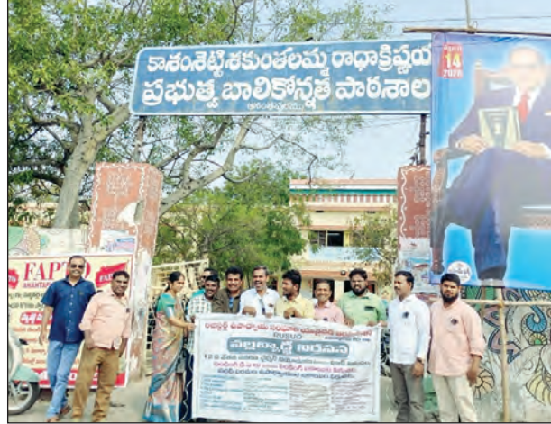
నిరసన తెలిపేస్తున్న రిజిస్టర్డ్ ఉపాధ్యాయ సంఘాల యునైటెడ్ అసోసియేషన్ నేతలు