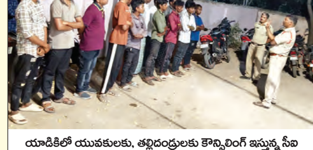
యాడికిలో యువకులకు, తల్లిదండ్రులకు కొన్ని రోజులకు ఇస్తున్న సీబి